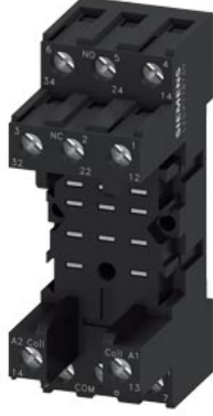
PT röle için soket modül 3 deęiřtirme kontaęı vida baęlantısı