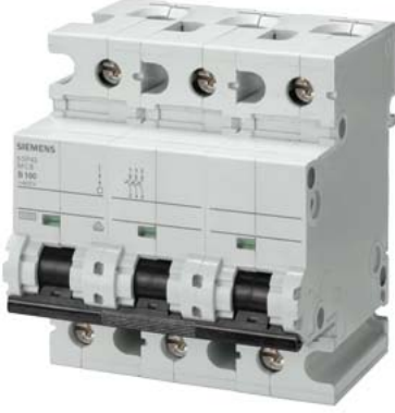
Miniature circuit breaker 400 V 10kA, 3-pole, C, 100 A, D=70 mm